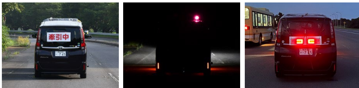
図 実験で使用了る反射器具（左）、回転灯（中央）、取付制動灯（右）

レッカー車の後部に被牽引車両を吊り上げた場合、レッカー車後部にある標準的な制動灯の後続車両から視認することが困難になり、特に高速度での走行となる高速道路等では、前方を走行するレッカー車のブレーキ操作に気付くのが遅れて追突事故に繋がる懸念されます。そこで、被牽引車両への追突防止機材の設置による視認性向上効果を検証するため、「反射器具や回転灯、取付制動灯を設置した場合の後続車両からの視認性を検証する実験（実験1）」、「回転灯や取付制動灯を設置した状態でレッカー車を減速させた場合の後続車両からの認知状況を検証する実験（実験2）」の2種類の実験を、昼間・夜間に実施しました。