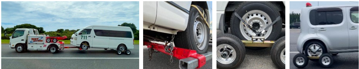
図 牽引の様子（左）、レッカー車と被牽引車の固定状況（左中）、被牽引車の後輪とドリーの固定状況（右中）、回転灯の設置状況（右）

実験は、被牽引車両の重量と牽引車両への固定方法の組み合わせにより 4 パターン設定しました。各パターンとも時速 60 キロメートルで合計 360 キロメートルを走行させ、60 キロメートル走行するごとに被牽引車両の固定状況、屋根に設置した回転灯の状況、被牽引車両の後輪に装着したドリーの状況の目視確認、ドリーの車軸温度の測定等を行いました。