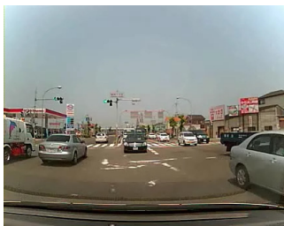
実際の交差点での右折シーン

さらに、中央研修所の模擬市街路において、教官による適切な右折方法及び一時停止方法について撮影をしました。