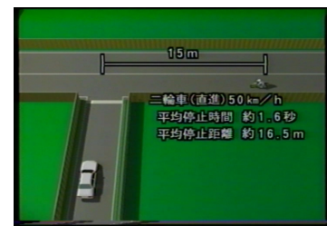
CGの一時停止の説明シーン