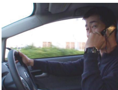
携帯電話使用のシーン