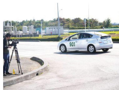
中央研修所での撮影シーン