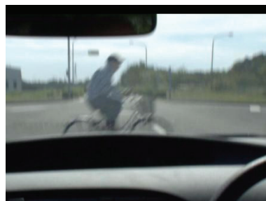
信号無視の自転車及び自転車との出会い頭に係るヒヤリハットのシーン