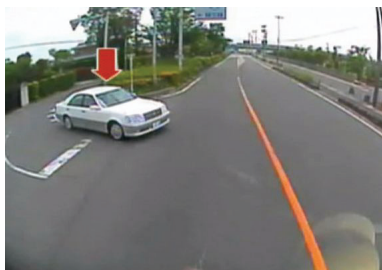
マナーの悪い車等によるヒヤリハット

また、事故防止解説をするための映像として、中央研修所において、見通しの悪い交差点での正しい一時停止の方法、サイドミラーの見え方の範囲、車間距離を時間に置き換える方法、車種による車内からの車間距離の見え方の違い等について撮影を行いました。