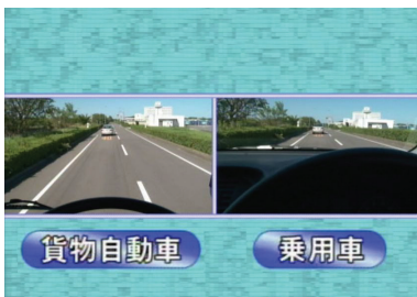
車間距離の見え方の違い