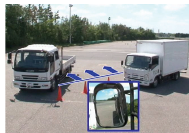
サイドミラーから見える範囲