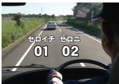
車間距離の時間置き換え方法