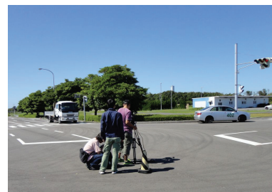
中央研修所での撮影