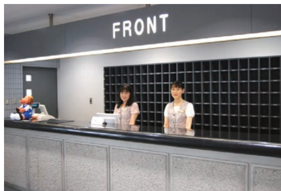
フロント（みなさまの研修受講をお待ちしております。）