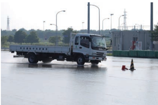
悪路を想定した、スラローム研修も実施しています。