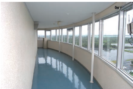
研修施設や国営ひたち海浜公園等が一望できる 9階展望室