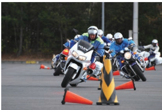
二輪課程のスラローム走行研修です。