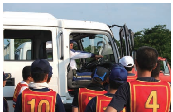
正しい運転姿勢を学びます。