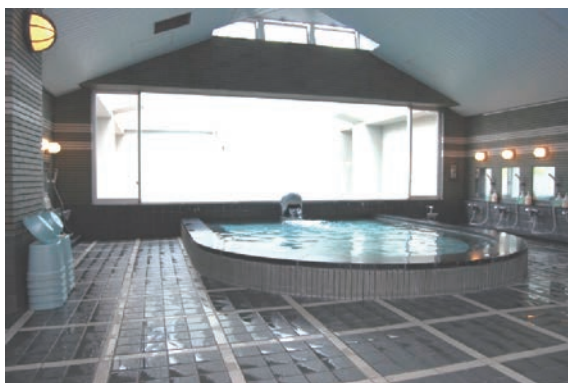
ゆったりとリラックスできる大浴場