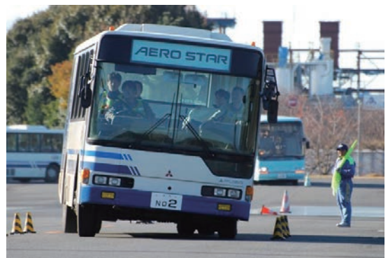
バス課程のスラローム走行研修です。