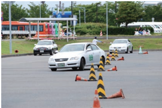
研修車両が次々と発進します。