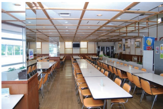
170人収容の大食堂（大型テレビ設置）