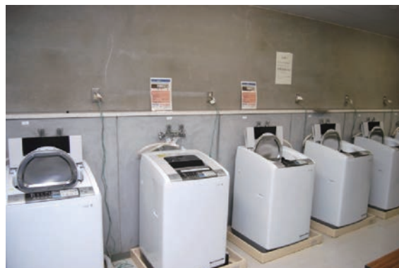
ランドリー（各階に備付け）