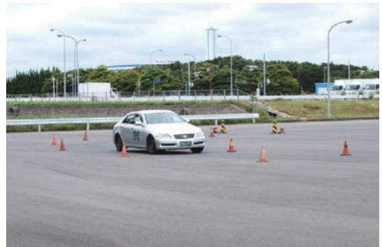
走行途中の半径約10メートルの半円コースです。